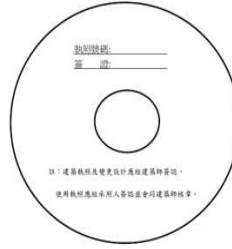
附件一：光碟片標示內容

附件二 連江縣政府工務局建築管理圖檔光碟資料繳交複核表 一、適用複核範圍：包括建照執照、變更設計、使用執照之光碟片均屬適用。 二、繳交建築圖檔光碟片由各業務科室受理及審核，並自行匯入本處建築圖影系統後由申請人領回。 三、本項複核僅屬繳交圖檔光碟片之概略再行確認工作。