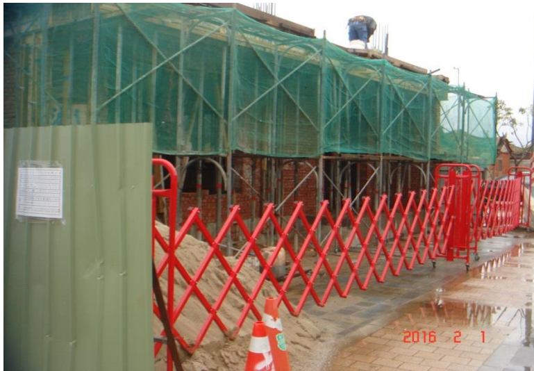
金門地區常見情形： 圍籬施作 工程告示牌