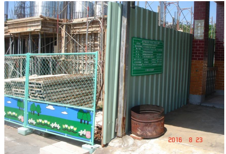
金門地區常見情形： 圍籬施作 工程告示牌