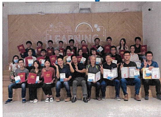
圖/2020 年度魯班學堂結業合影

BIM 是建築物生命週期中所有圖文資訊的數位處理與呈現方式，用來協助工程界跨領域或跨生命週期階段間數位資訊的交換與整合。ArchiCAD 等軟體是專門為 BIM 建築資訊模型所建立的工具，提供建築生命週期中詳盡的整合資訊，以利業主和承包商透過更精確的方式讓設計視覺化，借此溝通、模擬建案的成本、排程和對環境的影響，進而提高專案效率、降低風險。