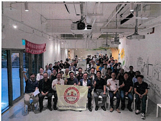
圖/2019年魯班學堂學員回娘家活動合影

11.特別公告:本次課程研習完成將頒發 GRAPHISOFT 原廠訓練完成證書。