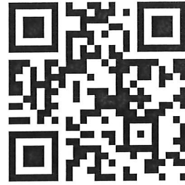
簡報資料 QR CODE